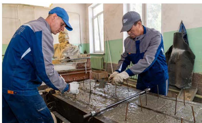
Из бетона собственного производства заливают бордюры, цокольные плиты, тротуарную, мозаичную плитку, фундаментные блоки